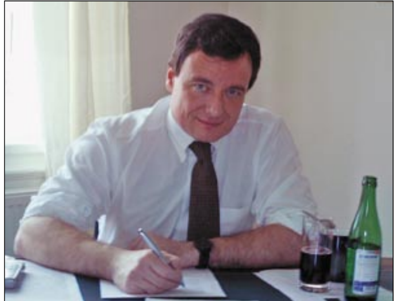
▲ „Ve Fakultní nemocnici Bulovka a v motolské nemocnici budou pacientům s onkologickým onemocněním ve výhledu několika týdnů k dispozici nejmodernější ozařovací přístroje na léčbu rakoviny. O jejich nákupu jsem rozhodl ještě ve funkci ministra, když jsem posoudil žalostný stav na těchto pracovištích. Tři výkonné přístroje by měly pokrýt potřebu onkologických pacientů v Praze i ve Středočeském kraji.“

Osud zprivatizovaných nemocnic nebude zcela určitě bezproblémový. Někde v těchto důsledcích mohou nemocnice naprosto zaniknout, jinde mohou být rozkradeny, mohou se také soustředit pouze na výdělečnou aktivitu – těch možností totálního rozpadu zdravotnické sítě v tomto případě ve Středočeském kraji je celá řada. Pro lidi ze středních Čech tedy vyvstane obrovský problém. Budou zákonitě nuceni vyhledat pomoc v pražských nemocnicích, které ale nemají žádné přebytečné kapacity, aby mohly případný nápor pacientů bezproblémově zvládnout. V samém důsledku to pak bude znamenat, jak pro nově přichozí pacienty, tak pro Pražany prodloužení čekacích dob