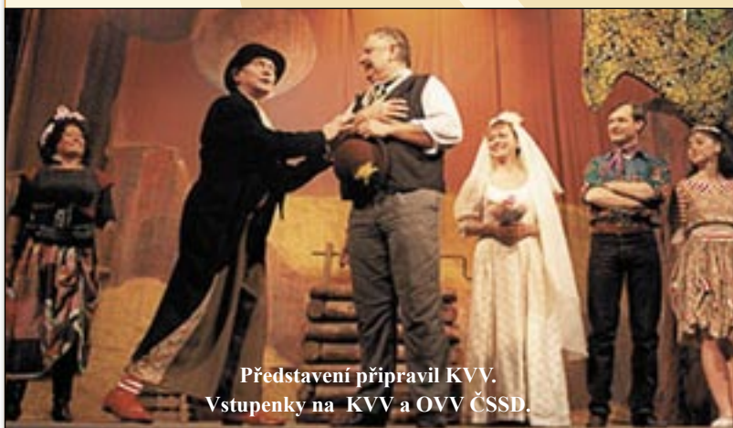
Představení připravil KVV. Vstupenky na KVV a OVV ČSSD.

„Přes lehký děj a kouzelné písničky, a taky přes Vás, pane Werichu, se na jevišti pokouším divákům v hledišti dodat dobrou náladu, pohodu a štěstí. V tom, doufám, kráčím ve Vašich „Čochtaních“ stopách. A mám Vás přes Čochtana ještě radši.“ Váš Josef Dvořák